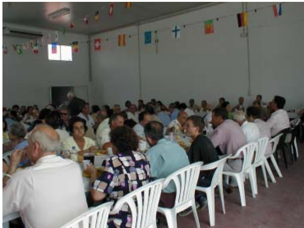
Excmo. Ayuntamiento de Granátula de Calatrava